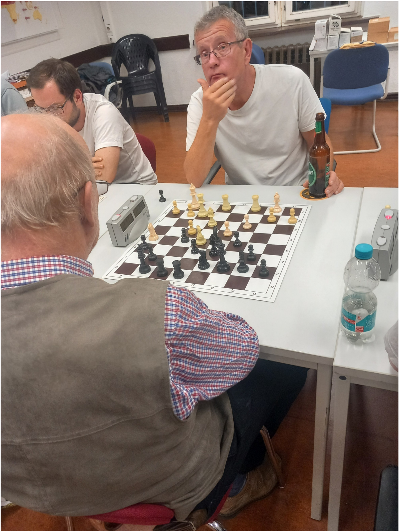
Abbildung 4: Der typische Blick eines Schachspielers... in die Luft blickend und nach der Lösung suchend.