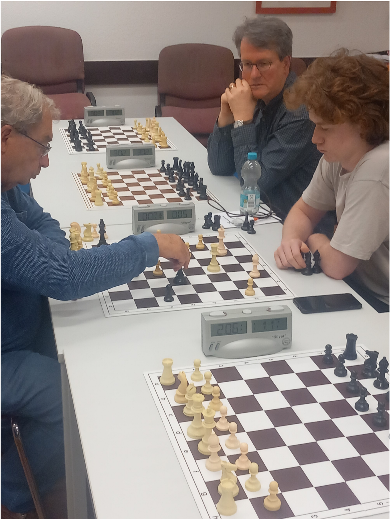
Abbildung 6: In diesem kritischen Augenblick ließ Weiß sein König im Schach stehen.... was aber nicht bemerkt wurde. Etwa 20 Züge siegte Weiß.