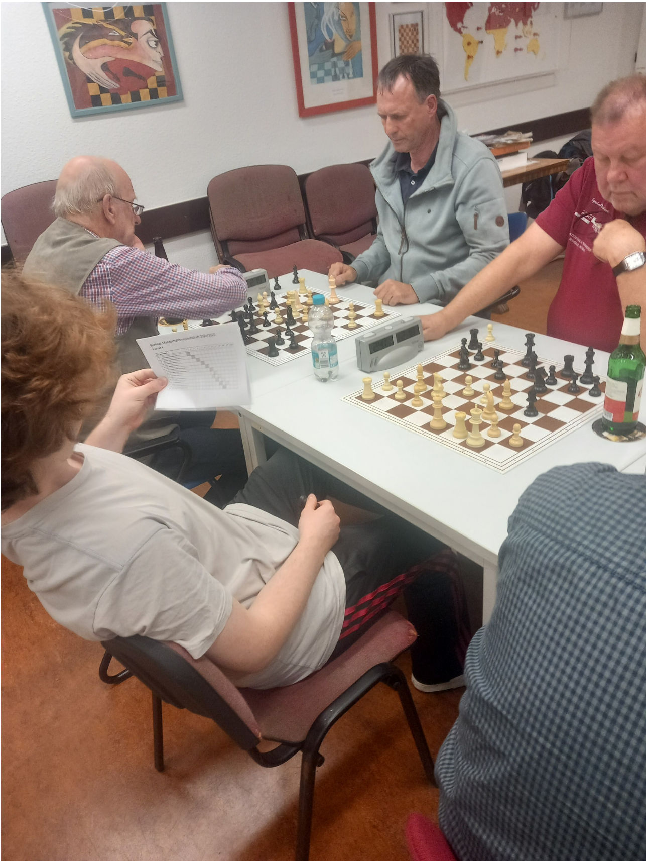
So zeigte sich Weiß wenig beeindruckt von dem Läufer auf g4 und setzte auf sein Zentrum.