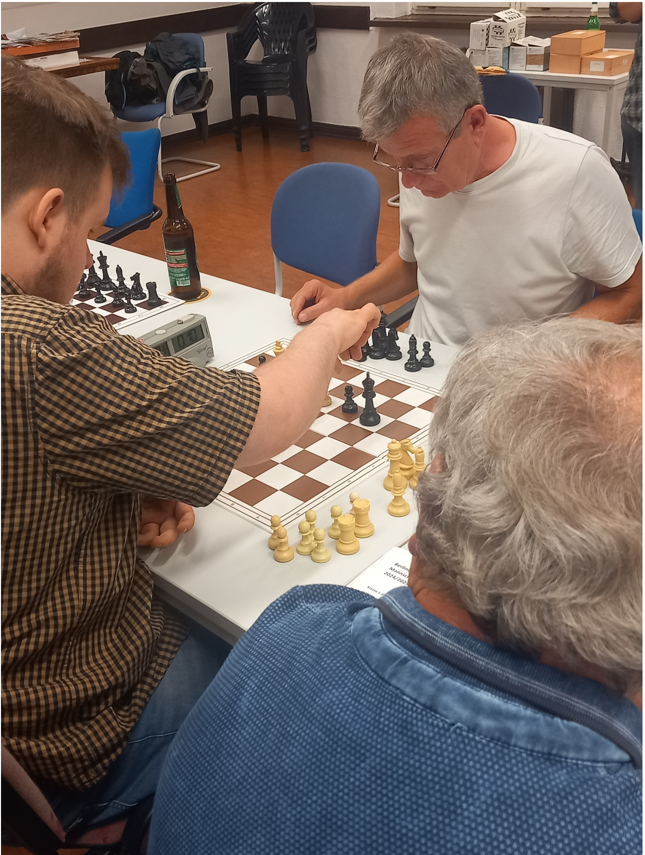
Gerade am Ausführen, so rannte der Bauer bald bis nach c2...