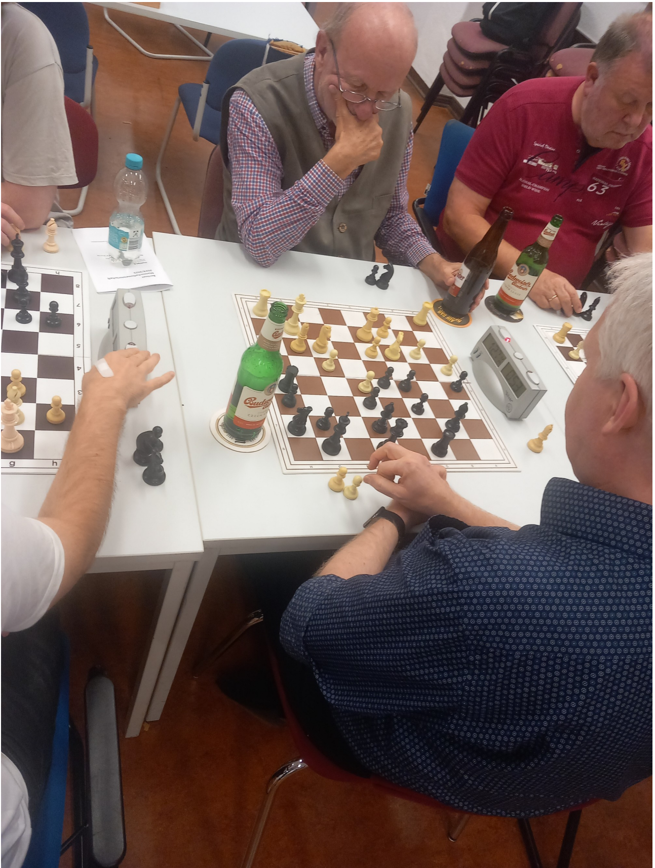
Abbildung 5: auch wenn es am Ende den weißen König traf. Selbst wenn der Lb7 noch etwas inaktiv war, waren die weißen Felder am Ende entscheidend.