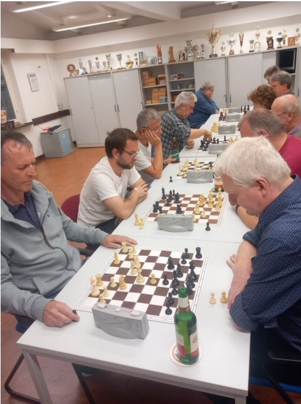
Abbildung 2: Volle Konzentration bei den Spielern

So kam es auch bei nominell höchst ungleichen Duellen zu einigen Überraschungsergebnissen.